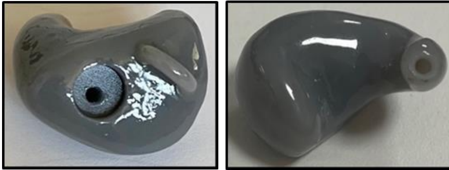
Fig. 2. Tappo dinamico: a sin vista anteriore, a ds vista posteriore.

Mediante l'utilizzo del "Fonix 7000 Hearing Aid Test System" abbiamo osservato come il "tappo dinamico" consenta di amplificare le frequenze comprese tra 500 Hz e 1000 Hz, e di abbattere prevalentemente le frequenze 4000-6000 Hz (Curva 1, Fig. 3). Al contrario la curva 2 evidenzia come un tappo completamente chiuso attenui indistintamente tutte le frequenze (Fig. 3).