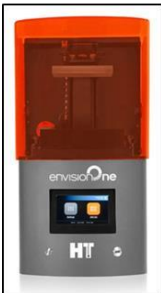
Fig. 1. Polimerizzazione in vasca.

L'obiettivo dello studio è quello di progettare e sviluppare un nuovo dispositivo di protezione uditiva individuale chiamato il "tappo dinamico" contro i rumori ad alta frequenza. Tale dispositivo è stato testato nell'ambito del personale sanitario che lavora abitualmente in uno studio odontoiatrico cronicamente esposto a fonti rumorose ad alta frequenza.