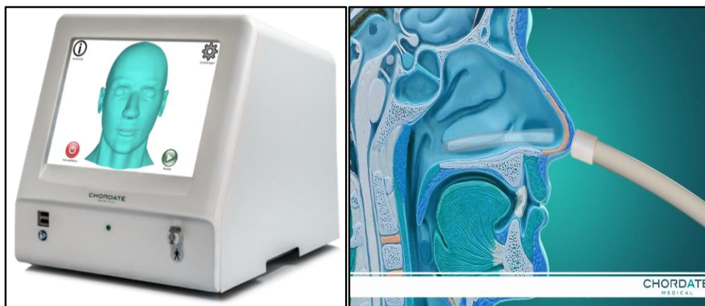
Fig. 5 e 6. Metodo K.O.S..

Sempre nell'ottica dell'applicazione di nuove tecnologie biomedicali, esse risultano sempre più informatizzate e digitalizzate e rappresentano una risorsa preziosa per tutti, medici e pazienti. Infatti, nel corso degli ultimi decenni, il progresso tecnologico in Medicina ha percorso strade con velocità inimmaginabili, investendo il settore medico con una molteplicità di innovazioni che hanno rivoluzionato le conoscenze di base ampliando e migliorando le possibilità terapeutiche. Di fatto l'utilizzo sempre più diffuso di sistemi intelligenti, in grado di apprendere, decidere e indirizzare il personale sanitario in determinate situazioni cliniche, ci consente di fornire prestazioni sanitarie sempre più all'avanguardia, con la possibilità di offrire protocolli diagnostici, terapeutici e riabilitativi integrati e personalizzati, di migliorare ulteriormente le performance ospedaliere e di incrementare l'assistenza sanitaria domiciliare, consentendo la cura dei pazienti da remoto.