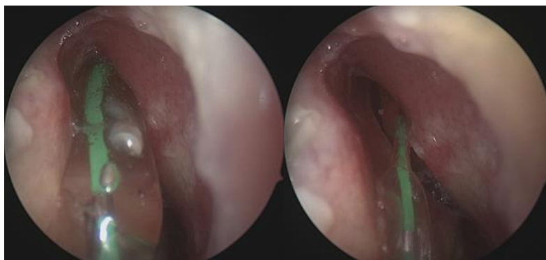
Fig. 1 e 2. Sinuplastica dilatativa.